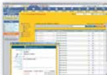
Una schermata del sistema di archiviazione e gestione dei documenti