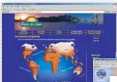
Baia di luna - Agenzie viaggi www.baiadilunaviaggi.it Offerte viaggi