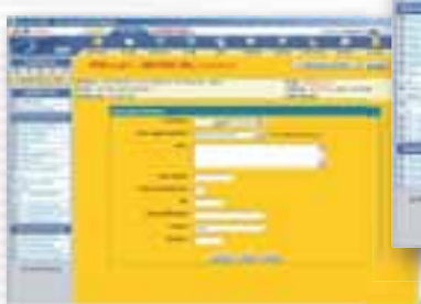
Una videata CRM per la modifica delle informazioni di ciascun cliente