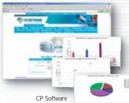
CP Software www.cpssoftware.it Analisi sul fatturato - grafici