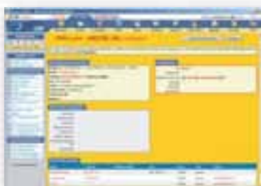
La schermata scheda cliente-fornitore del modulo CRM di WPOffice

■ Inserire dati di qualsiasi tipo relativi all'attività commerciale e alla scheda cliente