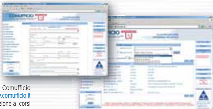
Comufficio www.comufficio.it Iscrizione a corsi