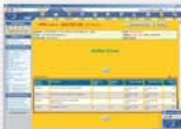
Una videata degli ordini evasi con dati filtrati per il cliente selezionato