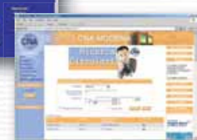
CNA - Modena www.mo.cna.it Banche dati ad uso degli associati e delle sedi comunali