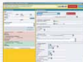
Una schermata di WP-Call Center

con grafici e rapporti generati in tempo reale