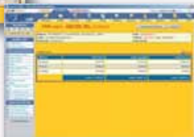
Schermata CRM contenente il fatturato per il cliente selezionato