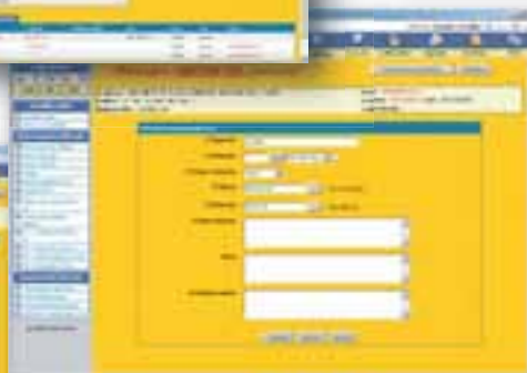
La schermata CRM per l'inserimento delle attività commerciali svolte per il cliente selezionato