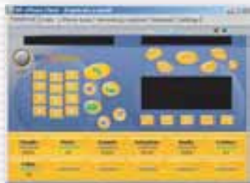
La videata di WP-ePhone, la soluzione software per i servizi di telefonia Internet

Una soluzione software che permette di realizzare reti telefoniche complete (centralino ed interni) su LAN, telefonia Internet ed applicazioni di CRM e Call Center, integrandosi con database e gestionali aziendali.